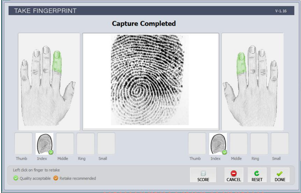
চিত্রঃ ০৪ – সফলভাবে Fingerprint সংগ্রহ পেজ